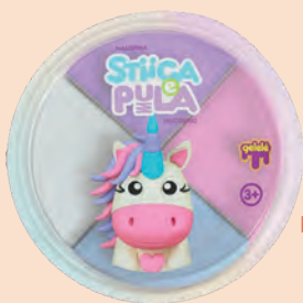
Brinquedo Estica Pula Gelele 14g/20g