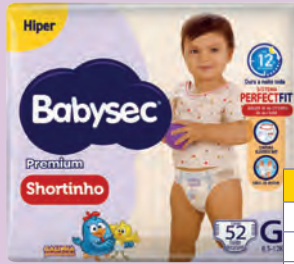
Fralda Babysec Shortinho Hiper Galinha Pintadinha