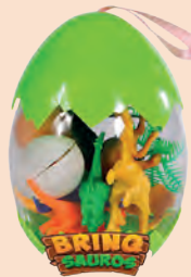
Ovo de Brinquedo Polibrinq Brinq Sauro