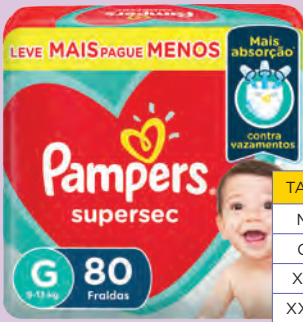
Fralda Pampers Supersec Jumbo