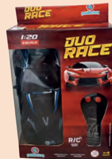
Carrinho de Controle Remoto Polibrinq