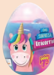
Ovo Surpresa Unicórnio Gelelé 98g