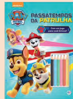
Livro Patrulha Canina Histórias