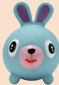
Bichinhos Weeego Colecionáveis