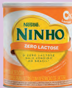
Composto Lácteo Nestlé Forti+ Zero Lactose 380g