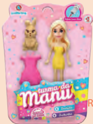
Boneca De Brinquedo Turma da Manu