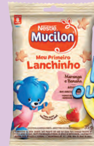
Snack Nestlé Mucilon Sabores 35g