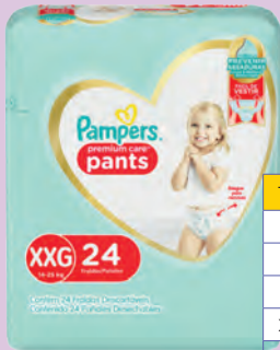
Fralda Pampers Premium Care Pants