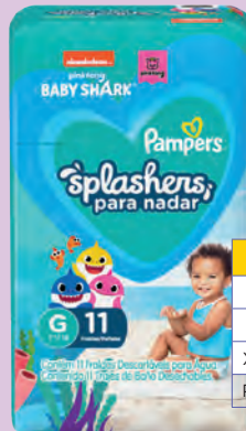
Fralda Pampers Splash Baby