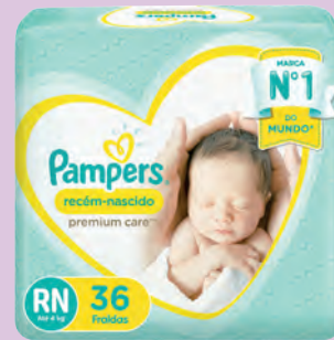
Fralda Pampers Premium Care RN+ com 36un