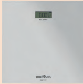
Balança Eletrônica Britânia BBL05TQ Body Fit