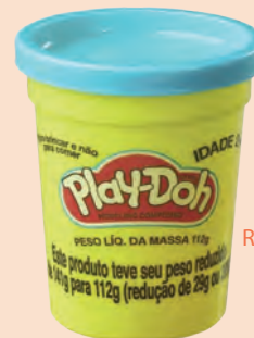
Pote Massinha de Modelar Play-Doh Hasbro B6756