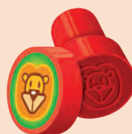
Carimbo Pedagógico Cis Stamp Animais