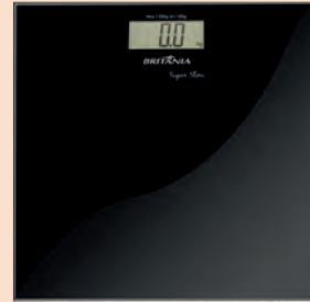
Balança Super Slim Britânia