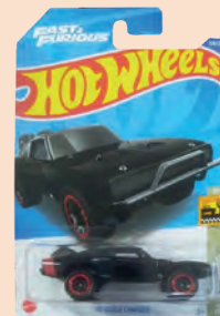
Brinquedo Carrinho Hot Wheels