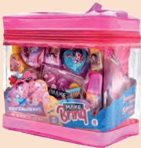
Kit Makebrinq Maquiagem Infantil