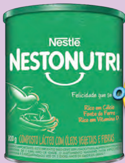
Composto Lácteo Nestonutri 1+ 800g